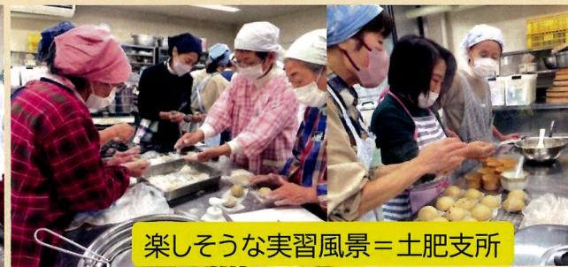
楽しそうな実習風景 = 土肥支所