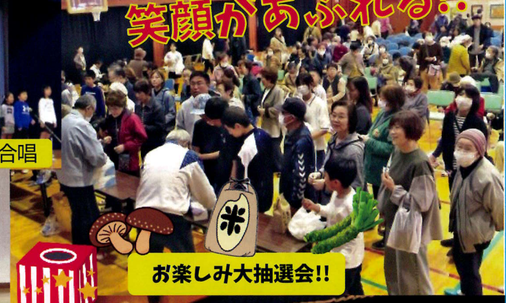
お楽しみ大抽選会!!