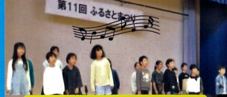
小中一貫校 3・4 年生合唱