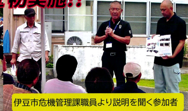
伊豆市危機管理課職員より説明を聞く参加者