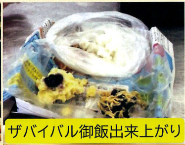
ザバイバル御飯出来上がり