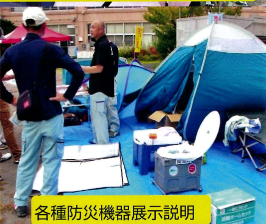
各種防災機器展示説明

南海トラフ巨大地震が想定される中、災害直後からの避難生活を想定した訓練を10月18日～19日土肥集学校グラウンドと体育館で実施しました。電気、上下水道が停止した状況で、トイレ、テントの設営、非常食づくり、救命訓練、宿泊体験等、各地区区長、地域づくり協議会委員、危機管理課職員が参加し、体験をしました。今後、アンケートや意見交換の声を防災機器の支援等に反映していく予定です。【生活安心部会】