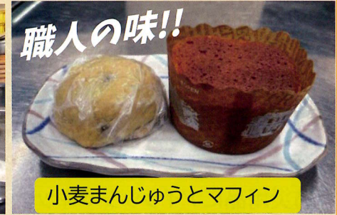
職人の味!! 小麦まんじゅうとマフィン