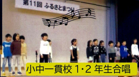
小中一貫校 1・2 年生合唱