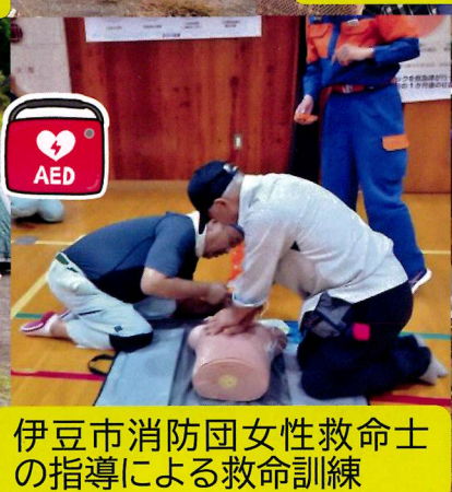
伊豆市消防団女性救命士の指導による救命訓練