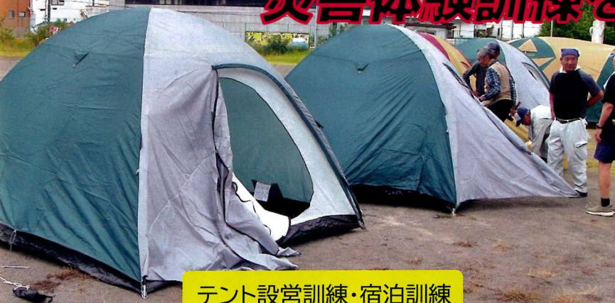
テント設営訓練・宿泊訓練