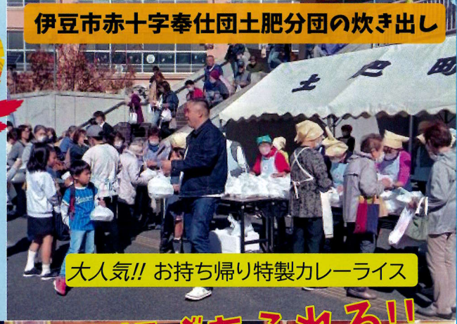
大人気!! お持ち帰り特製カレーライス

秋晴れの空の下、第11回ふるさと祭りを開催しました。参加者数 309 名、ステージイベント見て“笑顔”景品当たって“笑顔”お弁当もらってハイ“笑顔、参加者一人一人が楽しみ、笑顔でつながる温かい祭りとなりました。