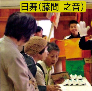
小中一貫校 9 年生体験販売