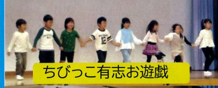
ちびっこ有志お遊戯