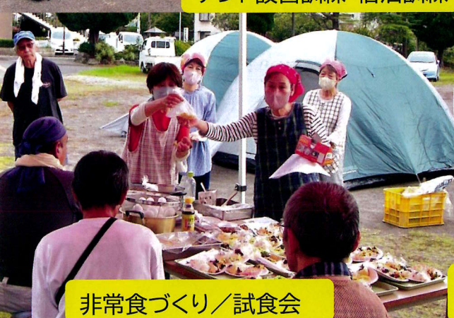
非常食づくり／試食会