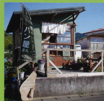
松鶴堂(しょうかくどう)