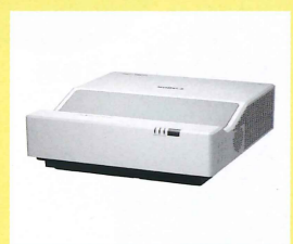
・短焦点プロジェクター 壁にピッタリつけて 100インチサイズ投写可能