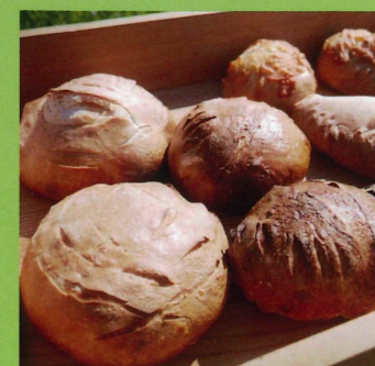
天然酵母使用のオーガニックパン