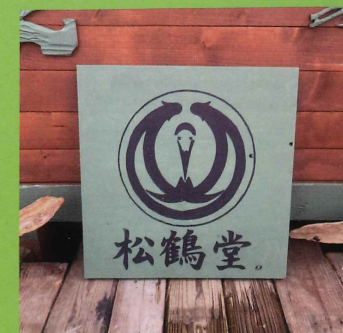
お店・シンボルマーク