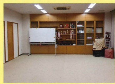
導入予定場所： 伊豆市土肥シニアプラザ1F