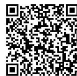
↑バスの接近情報(QRコード)