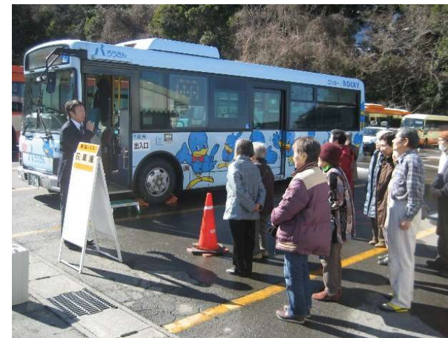
↑バスの乗り方教室