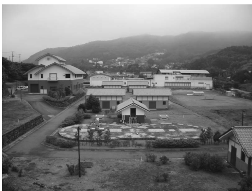
白岩浄化センター、奥は温水プール

中伊豆地区の下水道整備に伴う水量の増加により、白岩浄化センター増設工事を日本下水道事業団に1億4,900万円で工事委託するもので、工期は17年度～18年度にまたがる13カ月を予定しています。