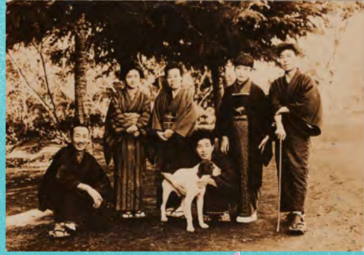
湯ヶ島にて 昭和2年（1927） 右から1番目が三好達治、2番目が宇野千代。

今年は宇野千代の没後30年にあたります。本展では、湯ヶ島文士村の紅一点・宇野千代を中心に、湯ヶ島文士村の歴史と青春の一幕を紹介します。