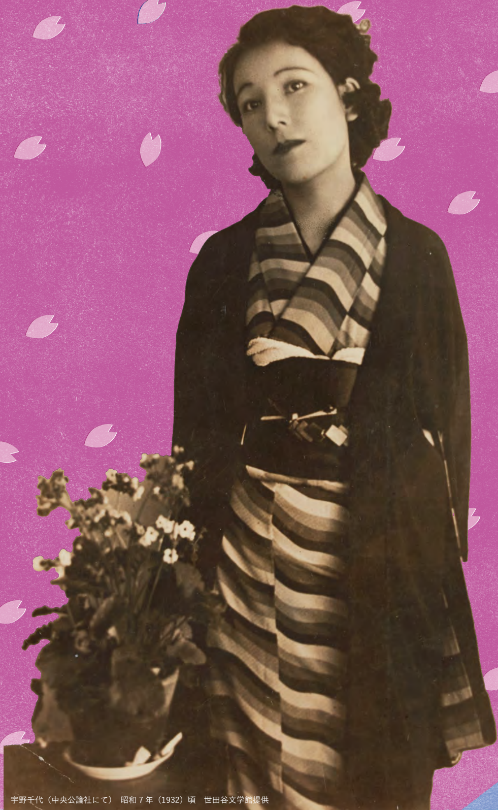
宇野千代 (中央公論社にて) 昭和 7 年 (1932) 頃