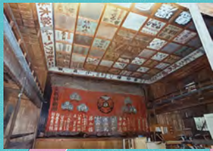
天城俱樂部内部 昭和後期頃

川端や尾崎士郎・宇野千代夫妻も通った芝居小屋「天城俱樂部」の設立趣意書。趣意書の段階では「湯ヶ島俱樂部」となっています。