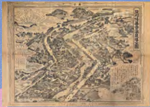
豆州修善寺温泉場全図（明治40年） 修善寺温泉場を描いた地図です。鉄道の開通にともない、明治～大正にかけてこのような観光地図が数多く発行されました。