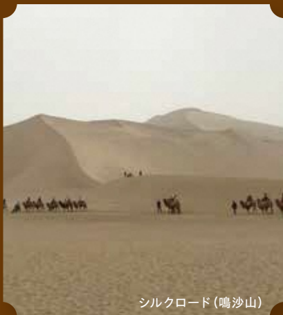
シルクロード (鳴沙山)

湯ヶ島で少年期を過ごし、生涯にわたり中国西域への憧憬を持ち続けた井上靖。どのようにして井上の中で中国西域への情熱が醸成されていったか。そこまで井上を惹きつけた中国西域の魅力とは何だったのか。伊豆市と敦煌市を結んで語り合います。