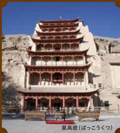
莫高窟 (ぼっこうくつ)

伊豆市湯ヶ島育ち。『しろばんば』などの自伝的小説や、現代小説、歴史小説のほか、中国を題材にした『敦煌』、『楼蘭』、『天平の雲』など、幅広いジャンルの作品を生み出した。1969年にはノーベル文学賞候補にもなった。