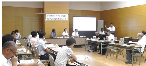
グランドデザイン案について説明を聞く参加者

左から中伊豆中、修善寺中、天城中のグランドデザイン 詳しい内容は各中学校のホームページからご覧ください