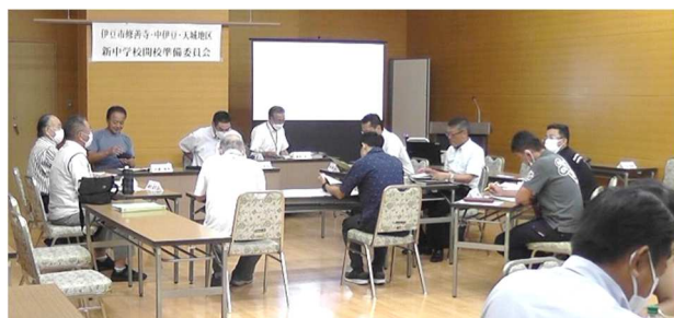
検討部会で活発に意見交換をする参加者