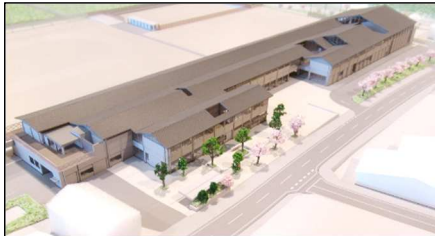
新中学校の校舎模型