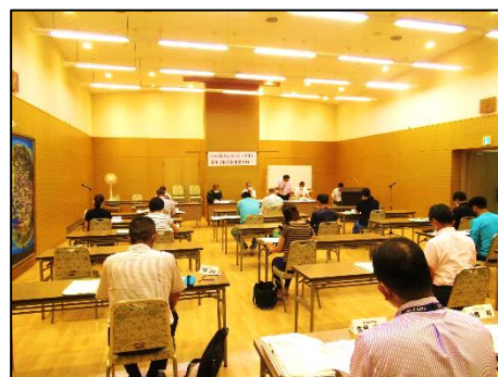
第2回準備委員会(中伊豆支所)