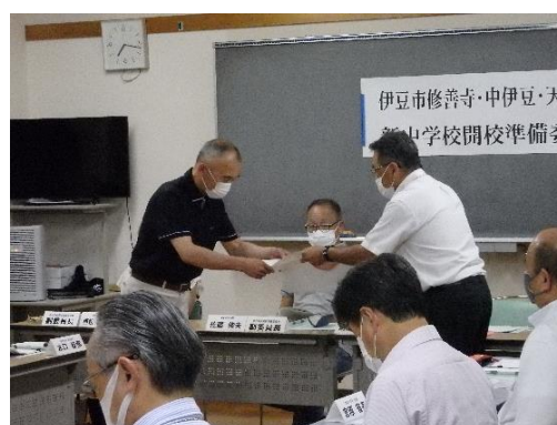
委員長に諮問書が渡される様子