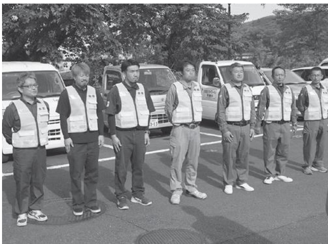
▲防犯パトロールに出発する隊員