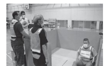
避難者誘導(高齢者)