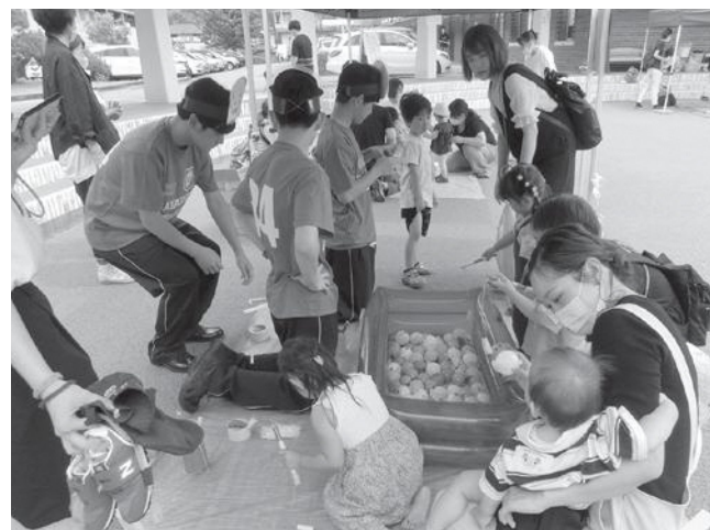
▲イベントを楽しむ親子と伊豆総合高校の生徒

6月18日、ゴムチップ舗装に改修した修善寺図書館前円形広場などで『みんなおいでよ！エンジンジョイ子育てフェス！』を開催しました。子育て中の皆さんと子どもたちが関わり合う場として、約150人が参加し、伊豆総合高校生徒が見本となったアンパンマン体操で始まり、水遊びやおもちゃの手作り、ぐりとぐらの読み聞かせに出てきたカステラを試食するなど、イベントを楽しみました。