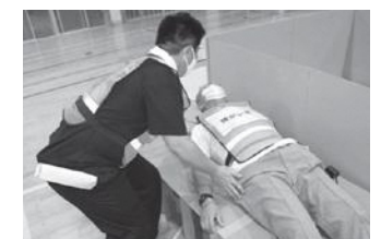
避難者誘導(障がい者)

○市職員から避難者の受付方法、避難スペースの活用方法、防災用品の使用方法などの説明を受け、実際に訓練します。