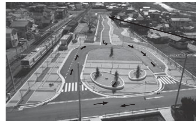
この先、車両通り抜けできません。