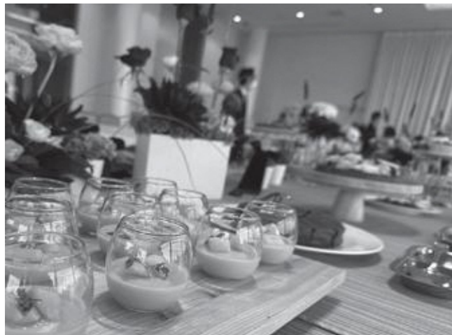
▲デザートビュッフェを通じて会話が弾んでいました

1 市主催の婚活パーティーで10組のカップル誕生! 2月6日、令和5年度3回目となる市主催の婚活パーティーを中伊豆ワイナリーで開催しました。男女33人が参加し、10組のカップルが誕生しました。 参加者からは、「初めての婚活だったが、プロによる事前セミナーなどのサポートもあり、安心して参加できた」など、大変好評でした。令和6年度も複数回の婚活イベントを予定しており、市公式LINEなどで随時情報発信していきます。