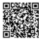
▲R6内閣府青年国際交流