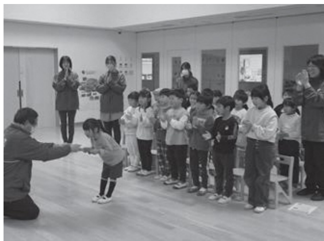
▲授賞式で表彰を受ける園児

2 田方地区合同自衛隊入隊予定者激励会 2月16日、生きいきプラザで、田方地区合同自衛隊入隊予定者激励会を開催し、入隊する伊豆市2人、伊豆の国市1人、函南町3人(入隊済み1人)のうち4人が出席しました。菊地市長から、「皆さん一人ひとりがこの素晴らしい家族、素晴らしい故郷、そしてこの素晴らしい国を守っていただく一助となって勤めを果たしてください。心から期待しています。」と激励の言葉を贈り、市町ごと入隊予定者に記念品を渡しました。