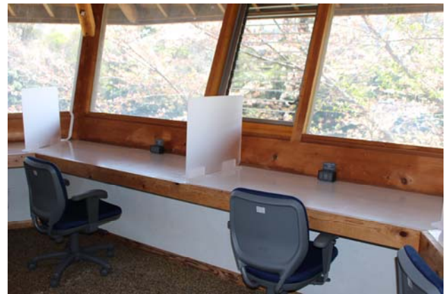
▲リバーサイドワークスペース（外観：内観）