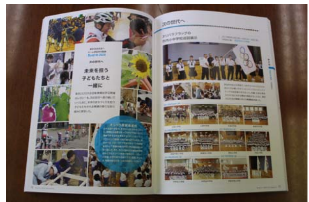
▲記念誌『Road to 2020 and beyond』