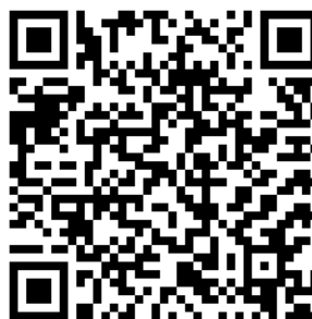
▲動画はこちらからご覧ください。