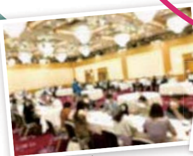
※写真はイメージになります。