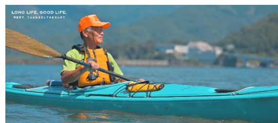
▲『伊豆市で、こんな生き方してみませんか？』動画（抜粋）