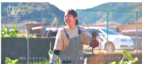
▲『伊豆で暮らそう』動画（抜粋）