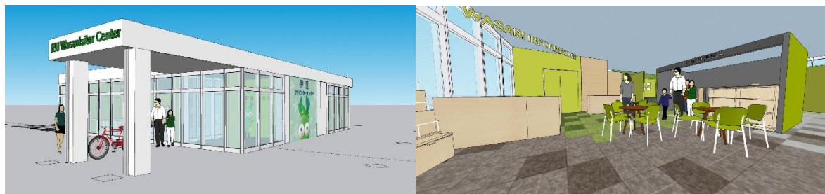
▲建物外観・内観イメージ