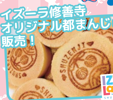
イズーラ修善寺 オリジナル都まんじゅう 販売!