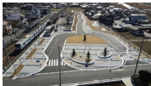
▲完成した牧之郷駅前広場