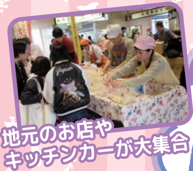
地元のお店や キッチンカーが大集合!