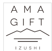
▲アマギフト認証マーク