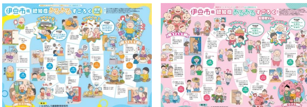
▲作成した『認知症あるあるスゴロク』

地域で暮らす認知症の人やその家族を応援する『認知症サポーター』を育成する『認知症サポーター養成講座』の講師