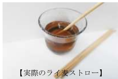
【実際のライ麦ストロー】