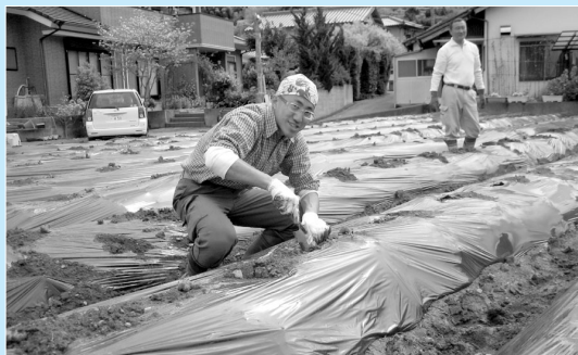
▲市役所の業務で畑仕事を体験しました

が伊豆市にたどりついで、早くも一ヶ月が経ちました。これまでのところ、ワサビ農家にお手伝いに行ったり、市役所の業務に参加したりしています。中伊豆地区の「筏場のワサビ田」は、東北仙台にいたるときから知っていました。しかしながら、やはり本物の「ワサビ田」