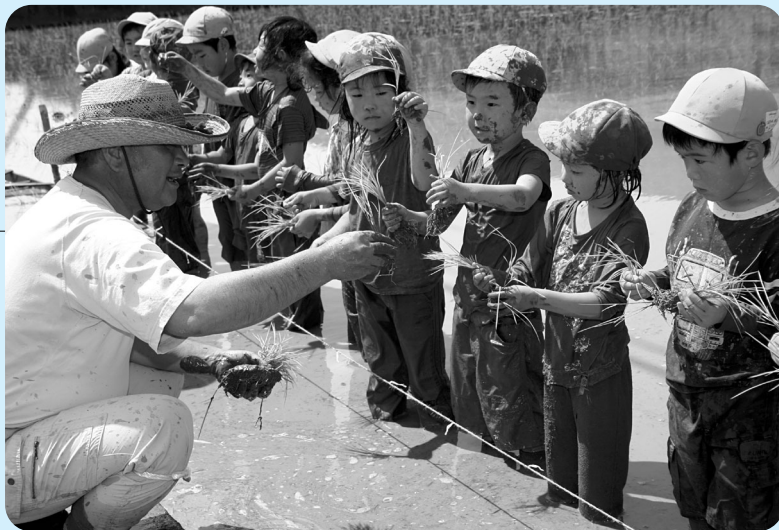
泥だらけになっておはしゃぎ。上手に植えられたかな？

5月8日(火) 修善寺保育園児による田植え体験が修善寺(紙谷)で行われました。天候にも恵まれ、園児たちは靴を脱ぐとさっそく田んぼへ飛び込み、代かきを兼ねた泥んこ遊びを始め、その後、園児たちは苗を手に取り、初めての田植えを体験しました。秋には、収穫も予定しています。みんなでおいしいお米を食べるといいですね。