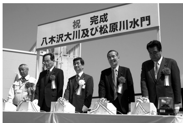
▲八木沢大川および松原川水門完成式 3 / 28