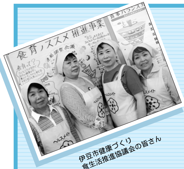
伊豆市健康づくり食生活推進協議会の皆さん

アンチョビーをみじん切りにし、ヨーグルト、Aを加えてよく混ぜる。 サニーレタスは一口大にちぎり、水気をよくきる。 食パンは1cm角に切る。フライパンにオリーブ油を熱し食パンを入れ、カリッとなるまで炒め焼きにしてクルトンを作る。好みの野菜(サニーレタスなど)を盛って、クルトンを散らし、のドレッシングをかけて粉チーズをふる。