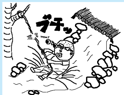
▲題名「休日のターザン」 作画=谷口多聞

また、先日参加させていただいた長岡中学校の総合学習の「豚汁」作りでは、初めから用意された薪をなたで割って使うのではなく、自分たちで森の中から拾い集め火起こしをしました。悪戦苦闘し、なかなか火をつけられずにいる生徒が多数でしたが、火起こしを「おもしろい」と目を輝かせながら話す生徒を見て、なんだかうれしくなりました。