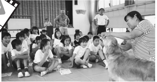
噛まれたら痛そうだなね・・・

子どもたちに 生きている命の実 感や犬ってどんな 動物が学んでもら おっと、動物保護 協会修善寺支部・ 静岡県東部保健所 主催、動物ボラン ティアグループ 「フイスト・わん」 協力により、月ヶ 瀬小学校4・5・ 6年生を対象に、 動物愛護教室が行 われました。講習 のあとは、実際に 犬と対面して、安 全な接し方や犬と 楽しむ方法など、