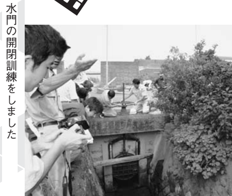
水門の開閉訓練をしました

が起き津波が発生した場合を想定し、集会所の近くの避難地を確認しました。また、海への水門があり、実際に開閉の訓練をしました。地域の皆さんは防災意識がとて高く、熱心に訓練に取り組みました。