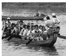
ドラゴンボートレースにも参加