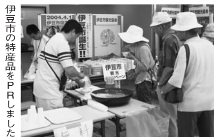
伊豆市の特産品をPRしました