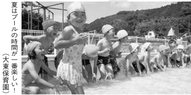
夏はプールの時間が一番楽しい！ (大東保育園)