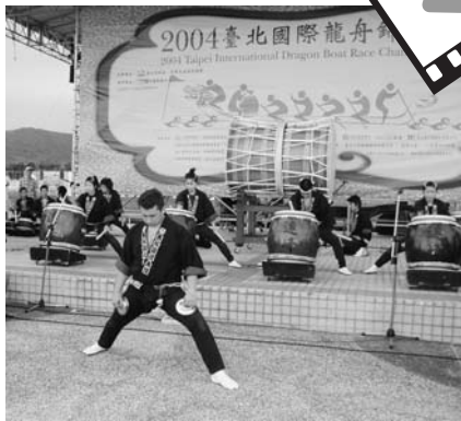
台北でも大盛況の天城連峰太鼓

天城湯ヶ島国際交流協会は、6月19日から5日間、天城連峰太鼓メンバーと共に「台湾台北市訪問事業」を行いました。