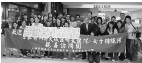
熱烈な歓迎を受けました

新聞のトップでもこのことが大きく取り上げられました。このことで、静岡空港の完成を目前に、アジアからの誘客を視野に入れた、観光地伊豆市のPRにも大きく貢献したと思われまます。また、当初予定にはなかった閉会式でも演奏も行い、滞在中、3ヶ所で計5回の演奏を行いました。最終日には日本人学校の小中学生千人の前で演奏し、太鼓の指導も行いました。今回の交流を通して、両市の友好関係がますます深まるといいですね。