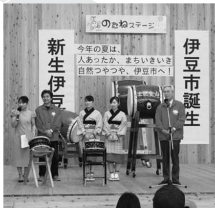
伊豆の踊子も会場で伊豆市をPR