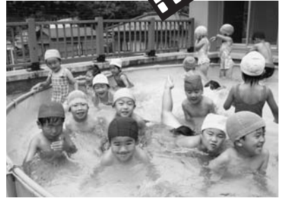
まわるプールだ！（湯ヶ島幼稚園）

ルでおおしゃぎする園児たちの元気な声が響きました。湯ヶ島幼稚園ではテラスに作られたプールに入り、気持ちよさそうに水遊びを楽しみました。暑い夏はやっぱりプール。子どもたちは大好きな夏のプールを思いっきり楽しみました。