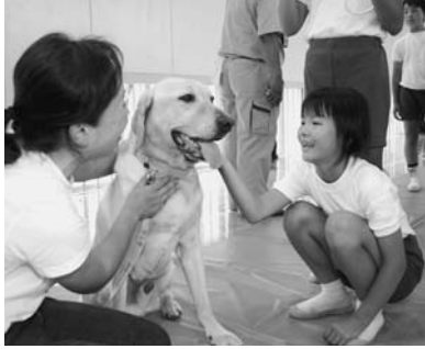
大きいけどおとなしいから怖くないね

学んだことを実践して きました。この教室をきつ かけに、動物に優しくで きるとういすね。