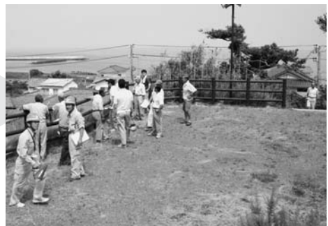
集会所裏の避難地を確認しました

が起き津波が発生した場合を想定し、集会所の近くの避難地を確認しました。また、海への水門があり、実際に開閉の訓練をしました。地域の皆さんは防災意識がとて高く、熱心に訓練に取り組みました。