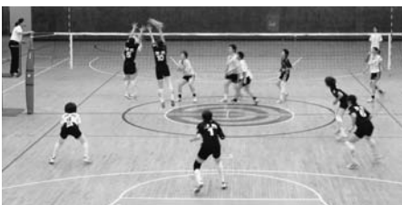
台北のチームと全力で戦いました