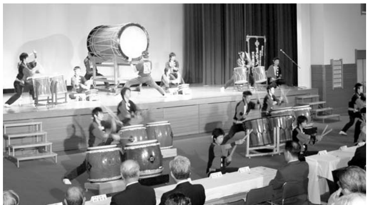
合併を祝う力強い太鼓の音色が響きわたりました