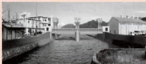
◀水門の完成イメージ図

静岡県では、東海地震に伴い発生が予想される津波対策として、土肥の八木沢大川河口部に耐震水門の建設に着手しています。