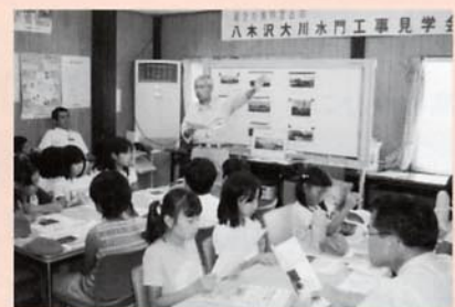
▲「ふむふむ」みんな真剣

始めに現場事務所で、この工事の目的や自然災害のことについてクイズを交えながら教わり、次に大きなヘルメットをかぶり現場をのぞきこむようにして、出来上がった基礎工事等について説明を受けました。今、水門本体工事では、工事現場に防音壁を設置するなど、騒音の低減化を図っています。このような工夫を、子供たちに理解してもらうために、大声大会を行ない、台風16号も吹っ飛ばしてしまうような大きな声が現場に響き渡りました。