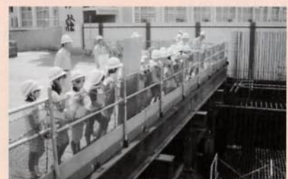
▲基礎工事をのぞきこんで「何があるのかな」