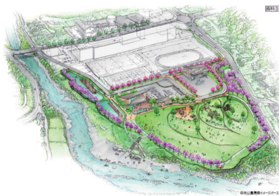
▲ラッピングされた(仮称)日向公園の完成イメージ図