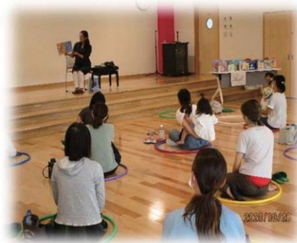
▲令和2年開催の様子