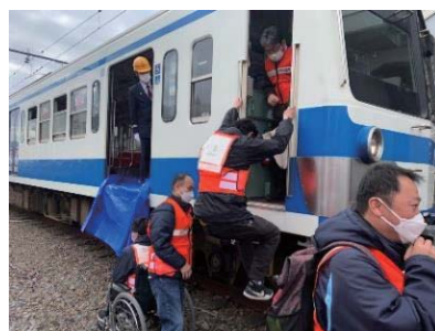
◀ 昨年度の伊豆長岡駅での要配慮者を降車させる訓練