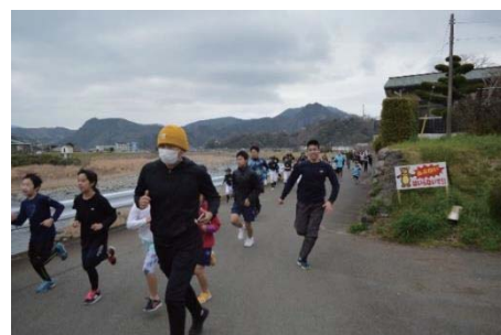
▲平成30年度狩野川桜マラソンの様子