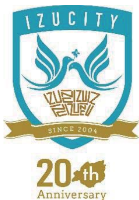
▲市制 20 周年記念エンブレム

わさびの花を口にした親鳥が成長して戻ってきた子どもを迎え入れている様子をグラフィック化し、ふるさと伊豆市を巣にたとえ、アルファベット I Z U で表現しています。