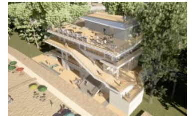
▲津波避難複合施設完成イメージ