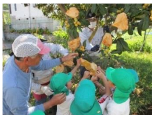
▲白びわ収穫の様子

土肥の特産品で、全国で土肥地区でしか生産されていない、なかなか味わうことができない希商品です。