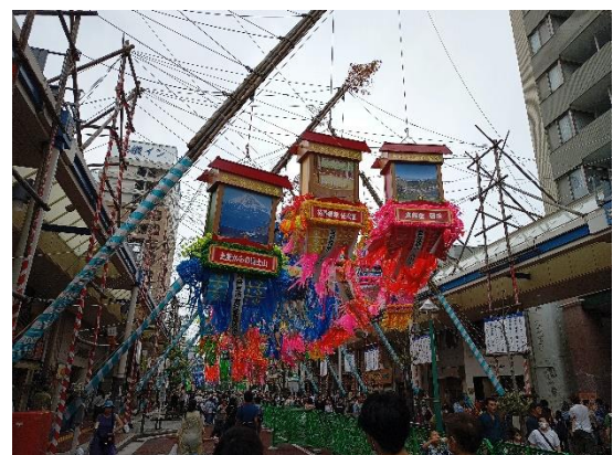
▲伊豆市の七夕飾り（一番左）