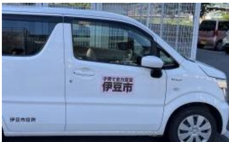
▲ 公用車マグネット掲出の様子