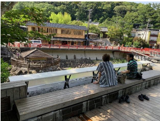
▲リバーテラス杉の湯