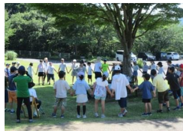
▲第1回ふるさと学級開講式・学習会の様子