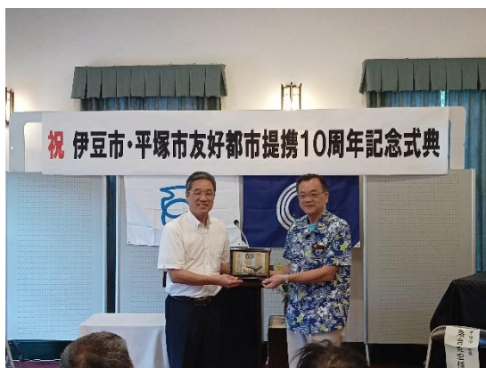
▲平塚市へ記念品贈呈