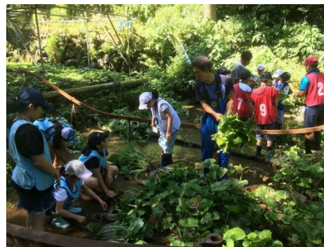
▲令和元年度の交流の様子