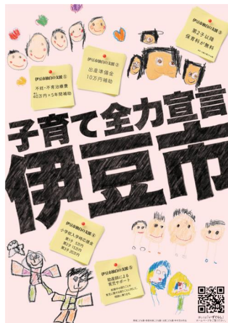
▲ 『子育て全力宣言』ポスター