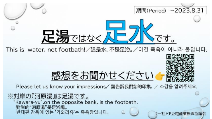
▲アンケート掲示（案）