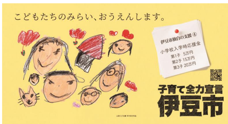
▲伊豆市子育て全力宣言（伊豆っ子未来応援金）ポスター