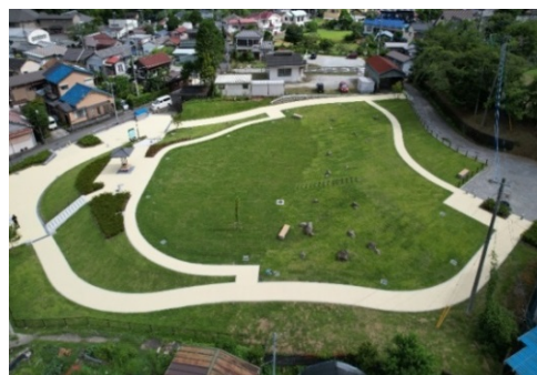
▲『しろばんばの里公園』

当日は、キッチンカーによる出店や木工教室、シャボン玉遊びなどを湯ヶ島地区地域づくり協議会にて行う予定です。