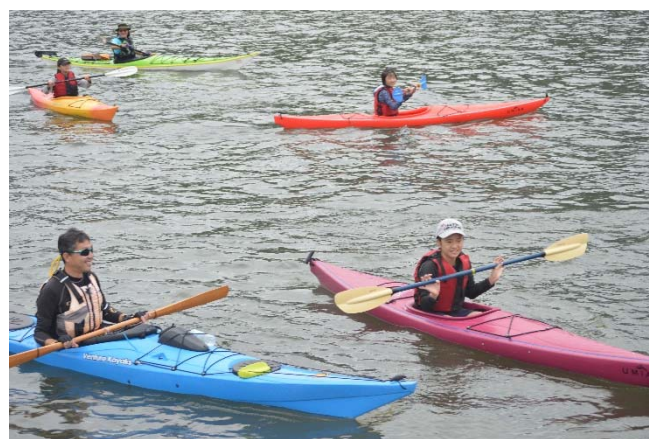
▲令和元年ふるさと学級の様子