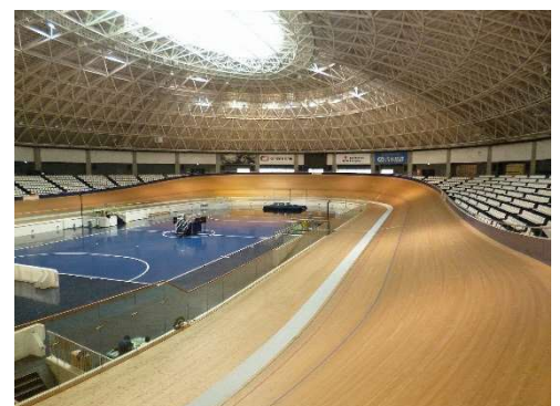
▲伊豆ベロドローム