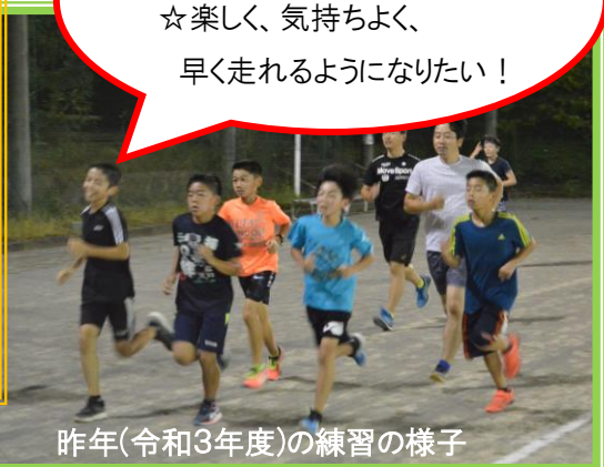
昨年(令和3年度)の練習の様子

—こんな方、大歓迎です— ☆とにかく走るのが好き！ ☆楽しく、気持ちよく、 早く走れるようになりたい！