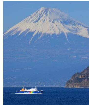
▲駿河湾フェリーと富士山