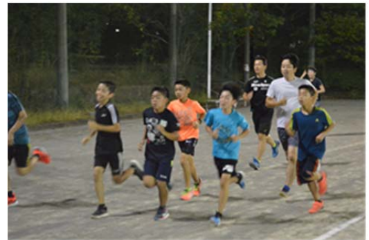
▲令和3年度の練習の様子