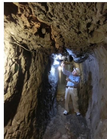
▲龕附天正金鉞の内部