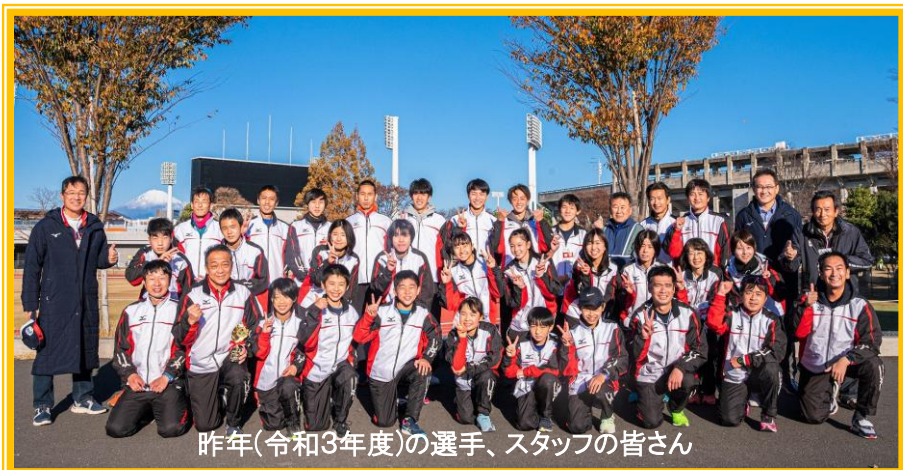
昨年(令和3年度)の選手、スタッフの皆さん

令和4年12月3日（土）に開催される「第23回静岡県市町対抗駅伝競走大会」に向けて、伊豆市チームとしての練習説明会を開催します。みんなで気持ちも記録も高められるチャンスです！ぜひご参加ください。