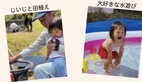
東京2020大会開催の記念写真

この2年で娘は田植えをしたり、水遊びをしたり、畑に行って野菜を収穫したり…。私たちが幼い頃に経験してきた自然豊かな伊豆市ならではの経験をたくさんすることができ、私自身とても嬉しく思います。大きくなるにつれて、今以上に伊豆市の自然に触れることができるようになるのが楽しみです。これからも、この大自然の中で家族みんなで成長していきたいです。(優歌ママ)