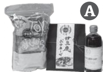
ジビエイタリアンセット