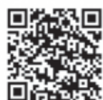
▲中小企業応援金QRコード

応援金コールセンター ☎0120-880-380 午前9時～17時(土日・祝日含む全日)