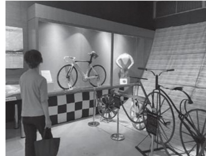
▲自転車の展示を見に来た市民

6月25日から9月29日まで伊豆市資料館で『自転車の都 伊豆展』を開催しました。伊豆市で東京2020大会自転車競技が開催されることを記念して『自転車とはどういったスポーツなのか』をテーマにした展示で、資料館には世界最古の自転車『ドライジーネ』や、自転車の歴史を記載したパネルを設置しました。伊豆ペドロドロームのバンクの傾斜も布で表現しました。