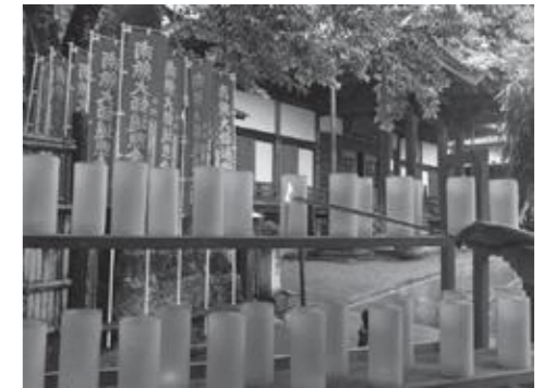
▲修善寺にてキャンドルナイトin修善寺温泉の火を譲り受けました

種火は、毎年修善寺温泉で行なわれているキャンドルナイトin修善寺温泉から譲り受けたりょうそくの火から採りました。