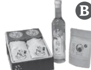
ティータイムセット