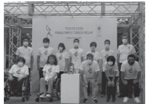
▲種火採火イベント採火者10人と伊豆市社会福祉協議会飯田会長と菊地市長