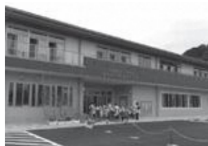
なかいす認定こども園 (八幡282-1) ☎0558 (75) 2810 受入年齢／2カ月～