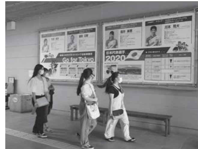
▲紹介幕を眺める高校生

8月16日から9月5日まで、修善寺駅西口広場の壁面に東京2020パラリンピック自転車競技日本代表選手の紹介と競技日程を掲載した幕を掲出しました。通りがかった地元の高校生は、紹介幕を見てパラリンピック競技開催への期待を語っていました。無観客開催となったパラリンピックですが、地元開催の意識と期待を高めていました。