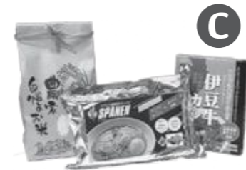
満腹スパイシーセット