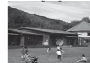
修善寺保育園 (修善寺3230-1) ☎0558 (72) 1748 受入年齢／8カ月～