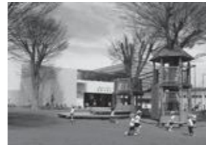
認定こども園あゆのさと (柏久保1309) ☎0558 (72) 1740 受入年齢／2カ月～