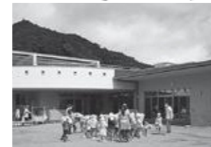
修善寺東こども園 (加殿22-1) ☎0558 (72) 1404 受入年齢／8カ月～