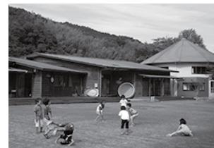
修善寺保育園 (修善寺3230-6) ☎0558 (72) 1748 受入年齢 8カ月～