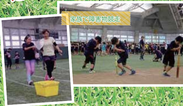
家族で障害物競走