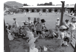
修善寺東こども園 (加殿72-1) ☎0558 (72) 1404 受入年齢 満1歳～