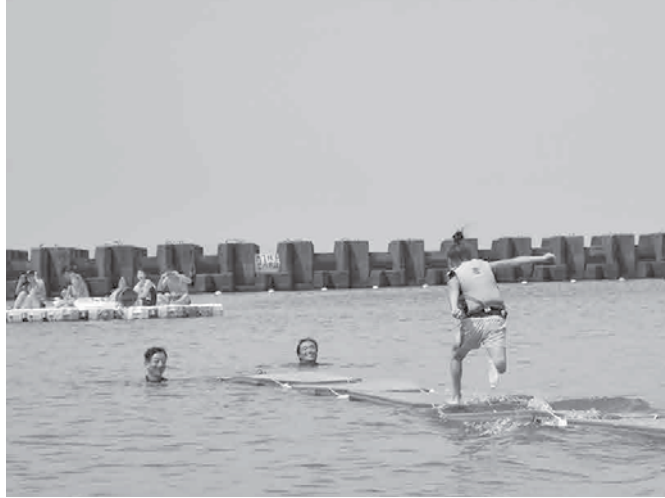
▲土肥の海上で畳の上を全力で走り抜ける参加者

8月27日(日)、土肥屋形海岸で「第3回土肥ビーチフェスティバル」が開催されました。参加者約100人が、ビーチフラッグや、ビーチボール、ビーチサッカーなどの砂浜ならではのスポーツを楽しみました。今年からの新種目「水面走り」では、海上に畳を並べタムを競い、子どもも大人も全力で畳の上を走りました。