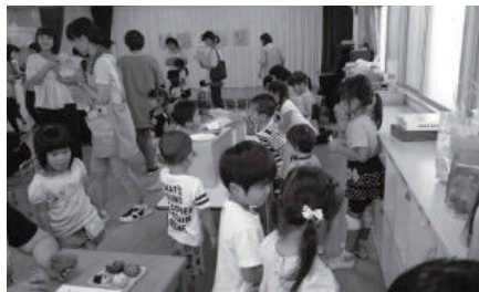
▲子どもの学びを見つめる公開保育

『幼保連携型認定こども園教育・保育要領』および『保育所保育指針』を基に、市の幼児教育課程を定め、環境とかがわり体験する保育に取り組んでいます。