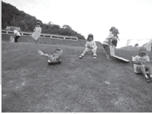
▲繰り返し挑戦「楽しいな」