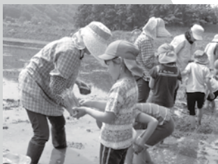
▲教えてもらいながら田植え体験