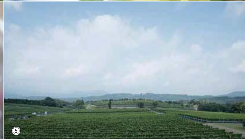
農場関係者が『えーる』の皆さんと一緒に作業をしている様子(写真①)、ブドウの1粒1粒を確認しての細かい作業(写真②)、信農リースリングという品種のブドウ(写真③)、中伊豆ワイナリーで育った木を使って販売している作品(写真④)、広大な中伊豆ワイナリーのブドウ畑(写真⑤)。