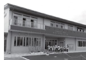
なかいず認定こども園 (八幡282-1) ☎0558 (75) 2810 受入年齢 2カ月～

市内の各園の公開を行なっています。この機会にぜひお越しください。 (日程は各園にお確かめください)