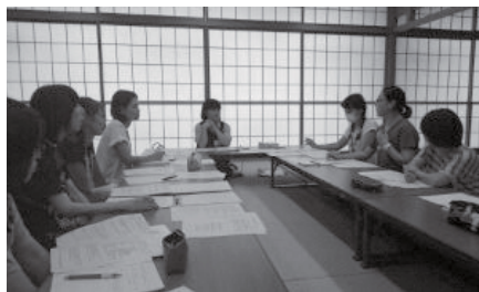
▲各園の実践を持ち寄る支援員研修