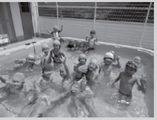
▲水って冷たくて気持ちいい!