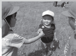
▲「ふうーってやってごらん」