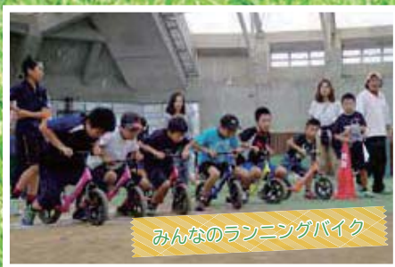
みんなのランニングバイク