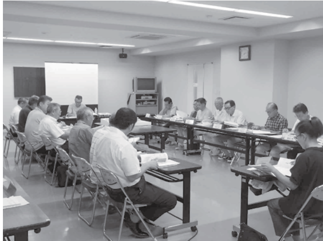
▲地域活性化に向けて意見を交わす協議会委員の皆さん

8月28日(月)、本年度最初の道の駅整備検討協議会が開催され、施設計画の進捗状況や管理運営方法のほか、施設や周辺地域の活性化に向けた活発な意見交換が行われました。市では協議会での意見を踏まえ、計画のさらなる検討を進めるとともに、指定管理者制度による管理運営に向けて、運営事業予定者の公募を10月から開始する予定で準備を進めています。