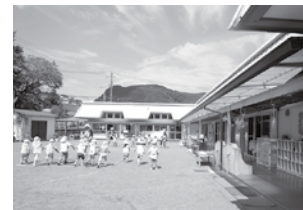
熊坂こども園 (熊坂426) ☎0558 (72) 1741 受入年齢 満1歳～