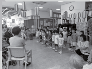
▲わたしたちの歌を聞いてね