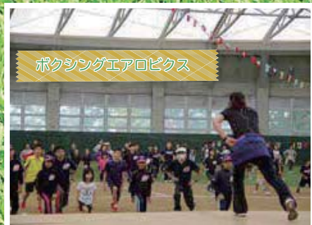
ボクシングエアロボックス