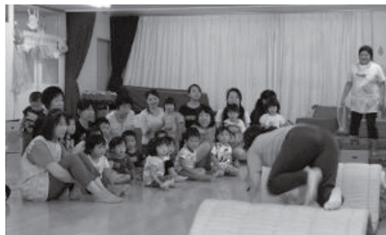
▲園児と一緒に運動遊び研修