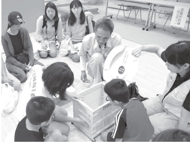
▲応急トイレの使用法の説明を真剣に聞く参加者

9月3日(日)、中伊豆小学校・中伊豆中学校を主な会場として総合防災訓練が行われました。避難者による避難所運営や居住スペースの間仕切り訓練や、応急トイレの使用法、消火訓練、災害装備品研修、災害用車両の展示、ペット同行避難訓練などを行いました。住民と市、自衛隊、警察、消防関係者など約600人が参加し、訓練に取り組みました。