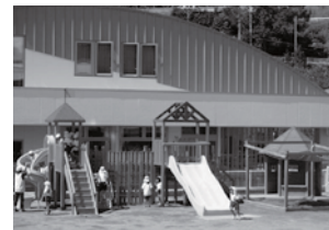
あまぎ認定こども園 (月ヶ瀬408-1) ☎0558 (85) 2030 受入年齢 2カ月～