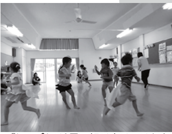
▲「しつぽとり」思い切り走り回ります