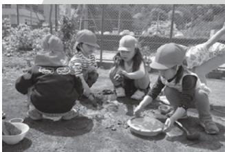
▲みんなで砂遊び「おだんごできるかな?」