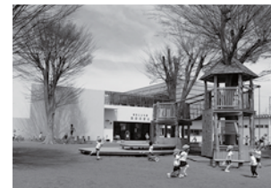
認定こども園あゆのさと (柏久保1309) ☎0558 (72) 1740 受入年齢 2カ月～