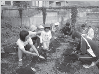
▲高校生と一緒に畑の手入れ