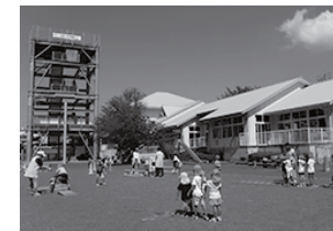
土肥こども園 (土肥665-26) ☎0558 (98) 0228 受入年齢 満1歳～