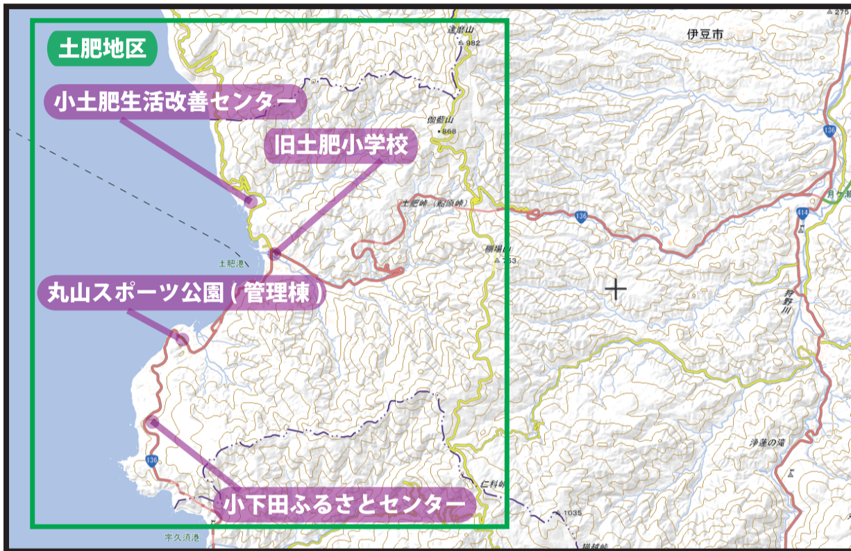
土肥地区 指定緊急避難場所位置図 国土地理院電子国土ポータル引用