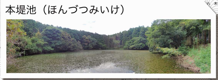
本堤池 (ほんづつみいけ)