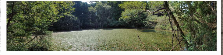
地丸管池 (きまりすぎいけ)