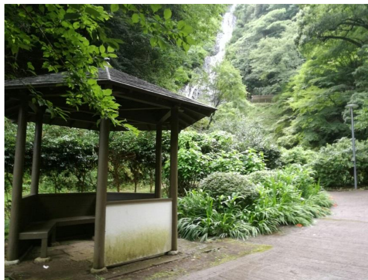
② 自然と観光が調和した地域振興の拠点