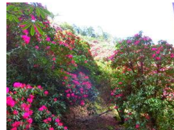
③ 天城山の自然を楽しむ癒しの景観