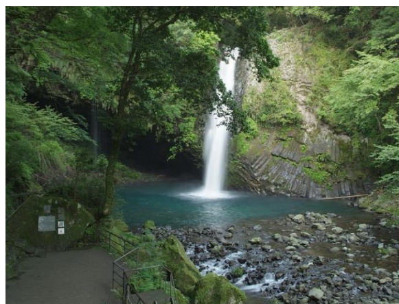
② 浄蓮の滝の眺望景観