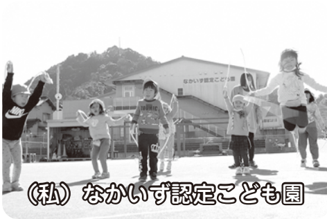
(私) なかいず認定こども園