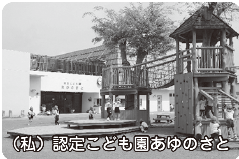
(私) 認定こども園あゆのさと