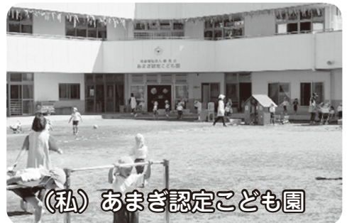
(私) あまぎ認定こども園