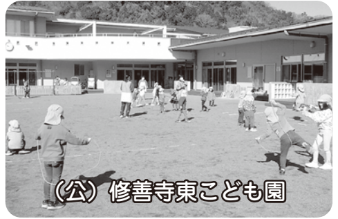
(公) 修善寺東こども園