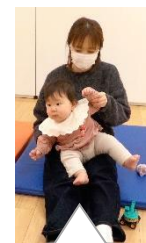
そろそろ右に曲がります～