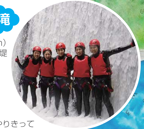
やりきって満面の笑顔!!