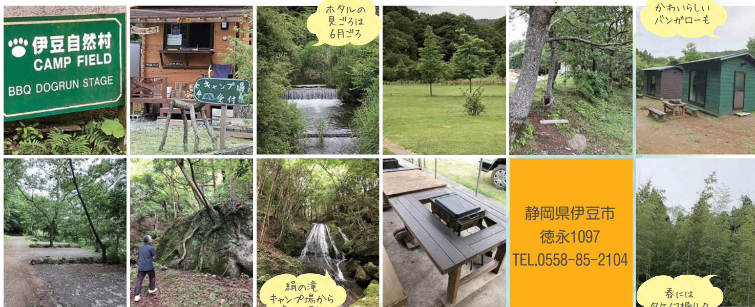
ホタルの見ごろは6月ごろ

春にはわらびやタケノコ堀り、初夏にはホタル、夏には水あそびなど。宿泊客は無料で楽しめます!! 林間サイトの奥にはなんと滝が!! 絹の滝(不動の滝)水量は少ないが夏はヒヤリと涼しい。 商売の神様がまつられてるんですって。