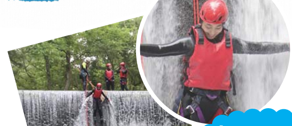
ロープで滝を降りる。