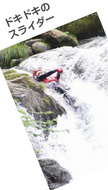
ドキドキのスライダー