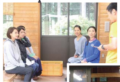
キャニオニング準備OK!