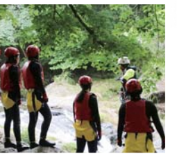
川での注意事項を聞きます。