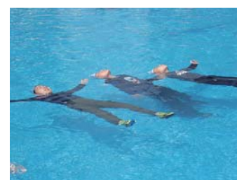
天城小での実習の様子