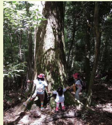
コピサワラ原生林にて 2012年