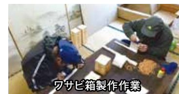
ワサビ箱製作作業