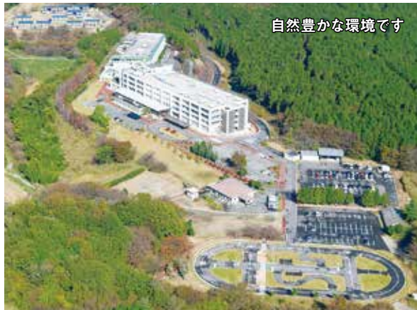
自然豊かな環境です

“あゆみ”では、地域で暮らす障がいをお持ちの方の「働きたい」「社会に参加したい」という気持ちや願いの実現を目指して、幅広い活動を行っています。