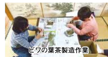
ビワの葉茶製造作業