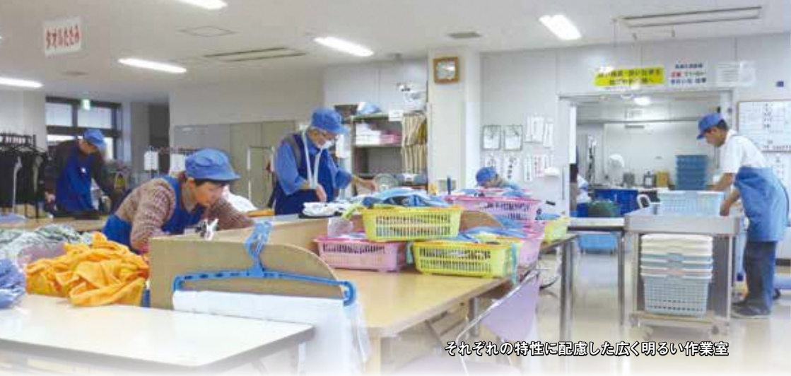
それぞれの特性に配慮した広く明るい作業室