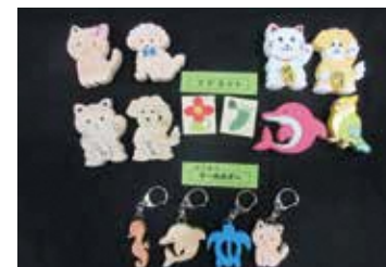
動物マグネット&キーホルダー