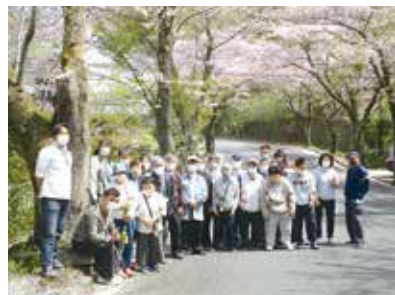
4月開所式の後 お花見

えーるは、自分たちの力で何かできることをしたいと願っている人たちに、地域との共生・共育を願いながら、福祉就労の場の中で、様々なサービスを提供し、就労に向けての支援を行い、将来の自立へ結びつくことを目指しています。