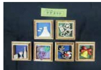
フレームマグネット