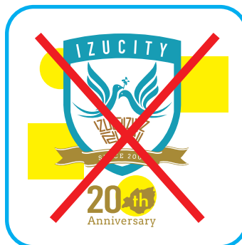
周囲にデザインを損ねるような 図形を配置してはいけない