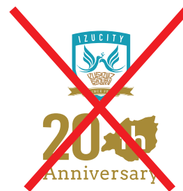
バランスを変えてはいけない