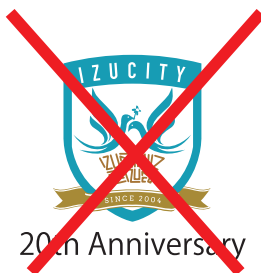
書体を変えてはいけない