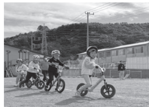
▲ランニングバイクに乗る園児たち

修善寺東こども園では、日本サイクルスポーツセンター職員による『ランニングバイク教室』を開催しました。5歳児18人が、はじめに乗り方やルールを教わり、前進走行やジグザグ走行、リレーなどで園庭を周回しました。ランニングバイクの走行に慣れない園児には、周りの園児たちから声援を送る場面があるなど、園児たちは終始笑顔で夢中になっていました。