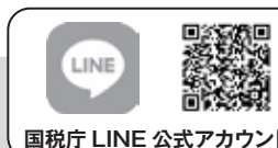
国税庁 LINE 公式アカウント

確定申告期前（1月5日（月）～2月13日（金））の申告相談の受付は、事前予約（LINEアプリと電話）により行っており、当日の受付枠はありません。