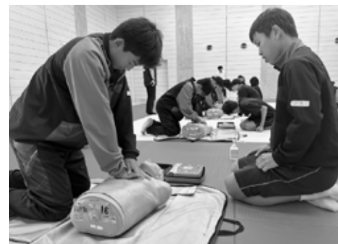
▲AED講習を受ける生徒

伊豆中学校で2年生を対象に普通救命講習の修了証とふじのくにジュニア防災士のW取得を目指し、伊豆市独自の『防災教育プログラム』を始めました。このプログラムは万が一の際に生徒が避難者ではなく、『避難所運営側の担い手』として行動できる知識と技能の習得を目指します。プログラムを受けた生徒からは「災害時に自分たちが地域を支える力になりたい」との力強い声が聞かれました。