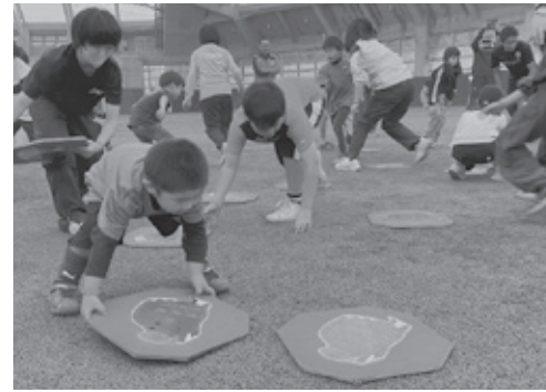
▲全世代が入り混じって陣取り合戦

天城ドームで開催し、1歳から63歳まで幅広い世代の市民、約130人が参加しました。玉入れや障害物競走、三択クイズ、ランニングバイク、みんなのリレーなどの競技を世代問わず、一生懸命取り組み、大きな歓声や笑顔に包まれながら運動を楽しみ、みんながさわやかな秋の汗を流しました。最後は恒例の『健康モチマき』で締めくくられました。