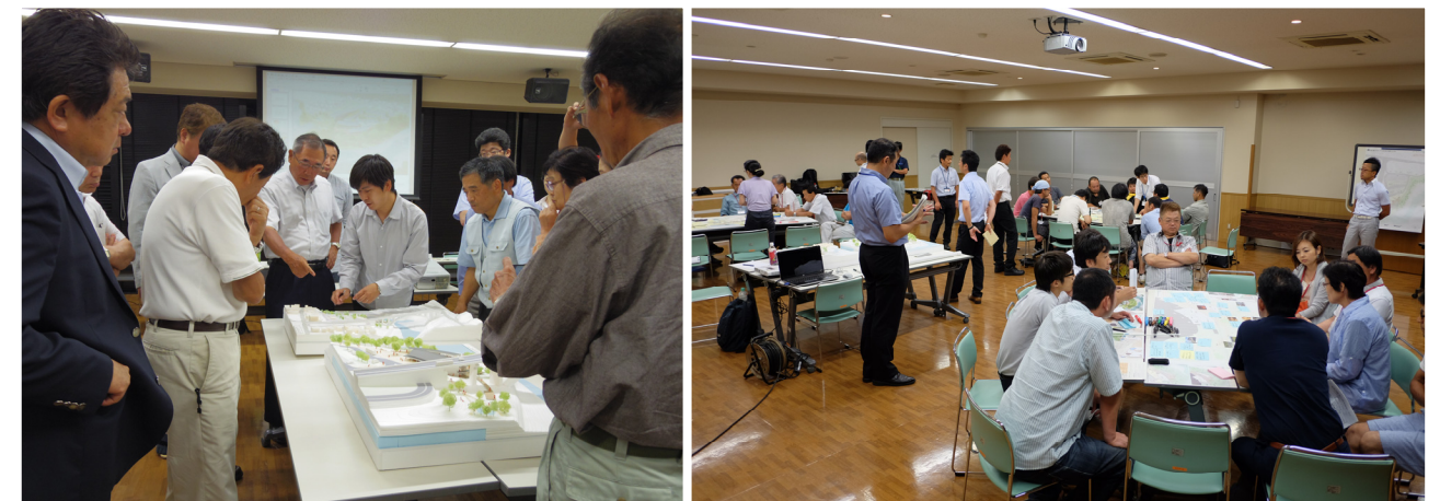
協議会及びワーキングの風景